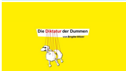
Zum Vortrag „Diktatur der Dummen“