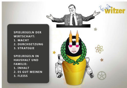
Zum Vortrag „Die Fleißlüge“