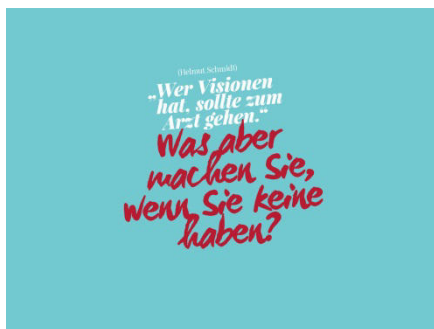
Zum Vortrag „Visionsentwicklung und Persönlichkeit“