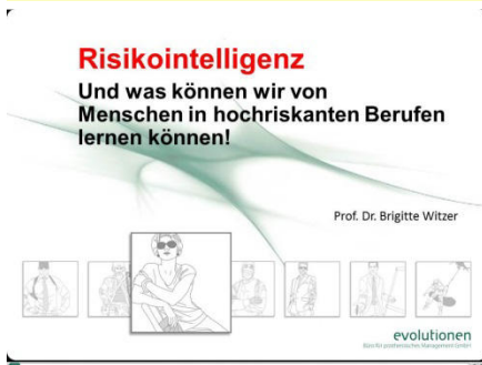
Eine Option zum Thema „Risikointelligenz“ und ...